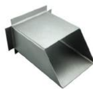
- Over Flow Pipe อุปกรณ์กันน้ำล้น