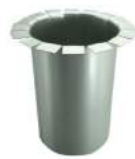
- Roof Drain ตัวเชื่อมต่อท่อระบายน้ำ