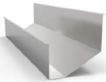
- Free form รูปแบบผลิตตามสั่ง