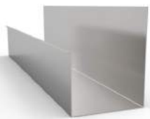
- TBG No.1 ทรงมาตรฐาน ป.ปลา