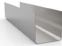
- TBG No.3 ทรงมาตรฐานตัวยูมุมตัด