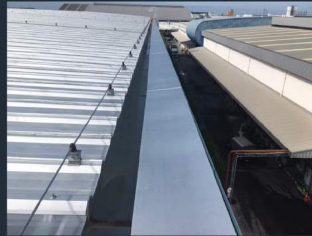
ตัวอย่างผลงานที่ผ่านมา