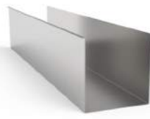
- TBG No.2 ทรงมาตรฐานตัวยูมุมฉาก